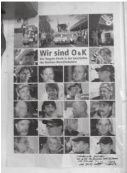
Die Solidaritätserklärung der KollegInnen von O&K aus Berlin ist im Betriebsratsbüro bei VIO.ME. ausgehängt.

möglichen Widersprüchen innerhalb der Belegschaft antworten unsere Gegenüber, dass alle mit den Möglichkeiten, die man gerade ausschöpfe oder anstrebe, einverstanden seien, unabhängig von der eigenen politischen Überzeugung. Alle anderen hätten die Fabrik verlassen.