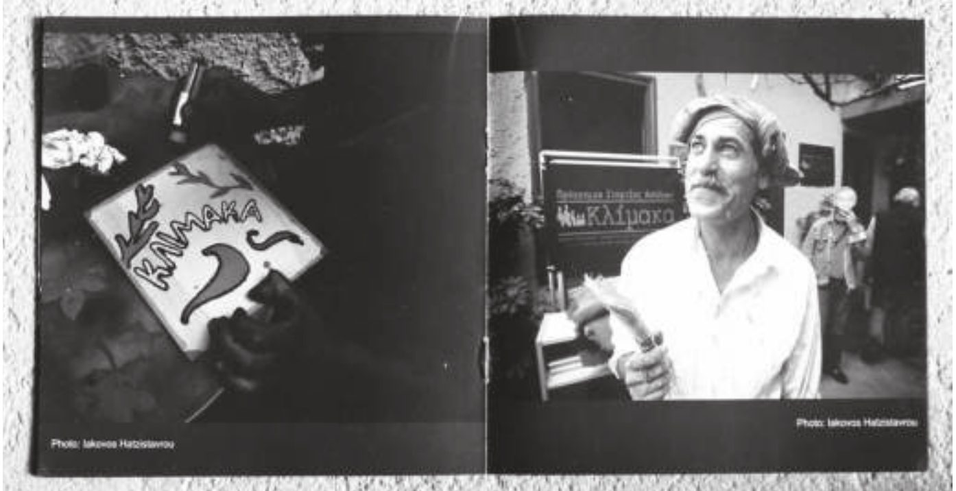
Informationsbroschüre von KLIMAKA