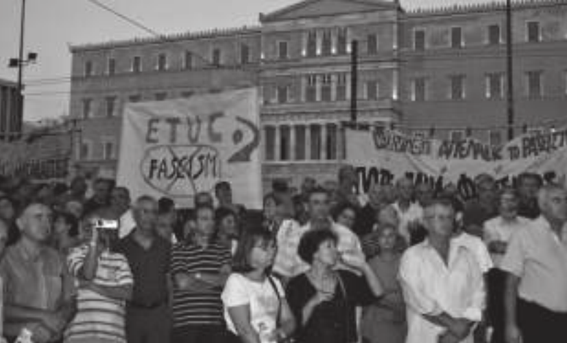
ZuhörerInnen der Kundgebung