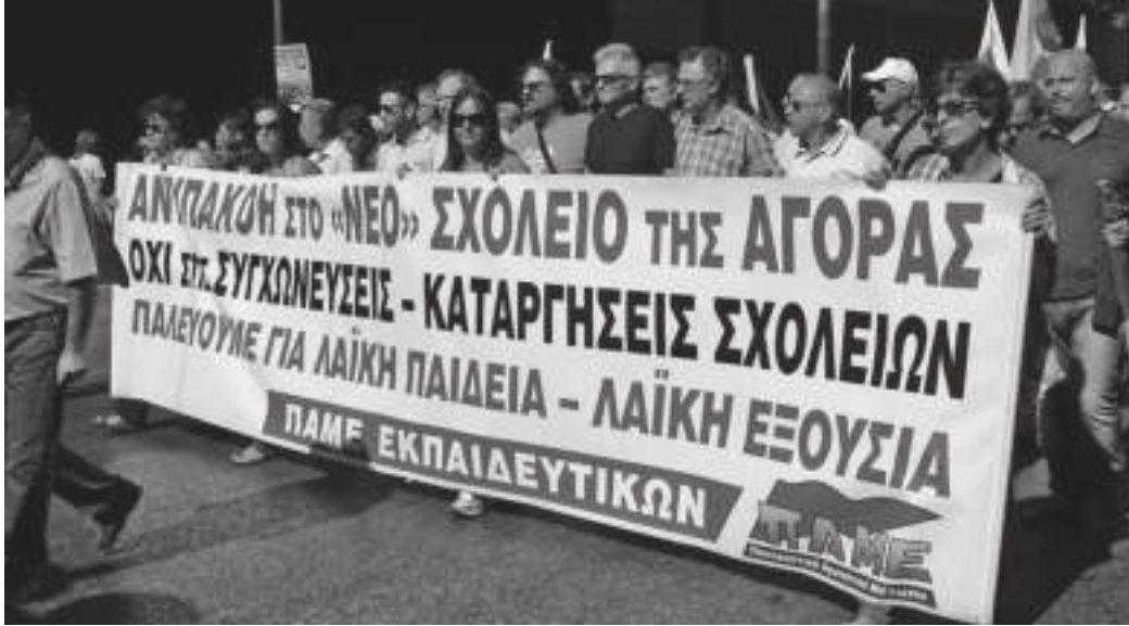
Demonstrationsblock der PAME: Gut organisiert aber abgeschottet von den anderen

abend so kurz vor der Kundgebung am Dienstag bekannt gemacht würde. Der Vorsitzende des GSEE konnte sich so bequem hinter der PAME verstecken.