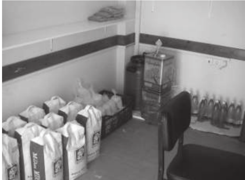
Nur die wichtigsten Grundnahrungsmittel können an Bedürftige verteilt werden

Das Arbeiterzentrum ist eigentlich gegen diese Form des „Ehrenamtes“. Es sollte aus ihrer Sicht nicht selbstverständlich sein, dass diese Angelegenheiten in dieser Form geregelt werden; dies sollte Aufgabe staatlicher Sozialpolitik sein. Sie wollen dafür kämpfen, diese Aufgaben (wieder) in die Hände des Staates zu geben. Bis dahin sind solche Projekte allerdings notwendig, um die Not zu lindern. In der Diskussion wurde gefragt, ob die individuelle Verteilung der Lebensmittel nicht dazu führt, die eigene Lage auch weiterhin individuell zu erfahren statt als gesellschaftlich verursacht. Yannis antwortete, die Absicht des Arbeiterzentrums sei es auf jeden Fall, die gesellschaftlichen Ursachen zu verdeutlichen und zu kollektiven Aktionen zu kommen. Die Empfänger der angebotenen Leistungen würden aufgefordert, an Protestaktionen teilzunehmen, was auch befolgt würde.